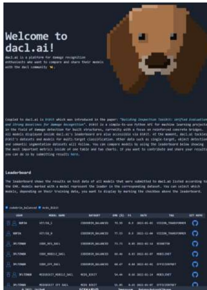
Figure 3 : Obtention de la 1ere place au Challenge CODEBRIM pour la classification de défauts structurels. https://dacl.ai/