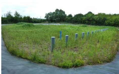
Filtre planté de roseaux à Moulin-lès-Metz (57)