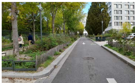
Noue végétalisée et bordures de trottoirs ajourées à Lyon

Des communes toujours plus nombreuses, à l'instar de Libourne (33) ou Chambéry (73), ont ainsi engagé une politique ambitieuse de gestion durable des eaux pluviales.