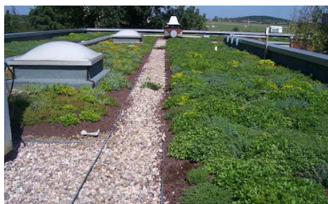
Toiture végétalisée du Cerema Est (57)