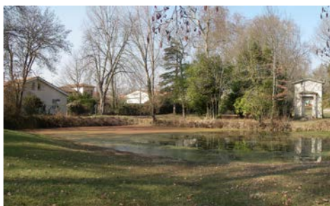
Bassin en eau, lotissement Cambon à Blanquefort (33)