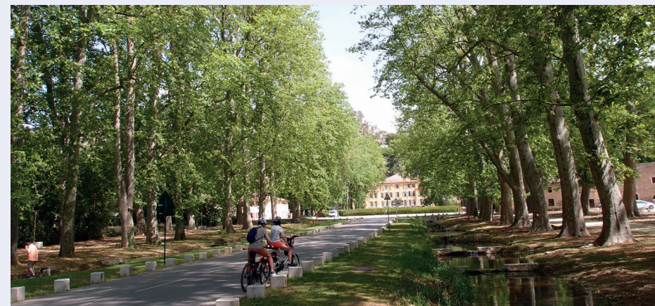
Allée de platanes au Tholonet