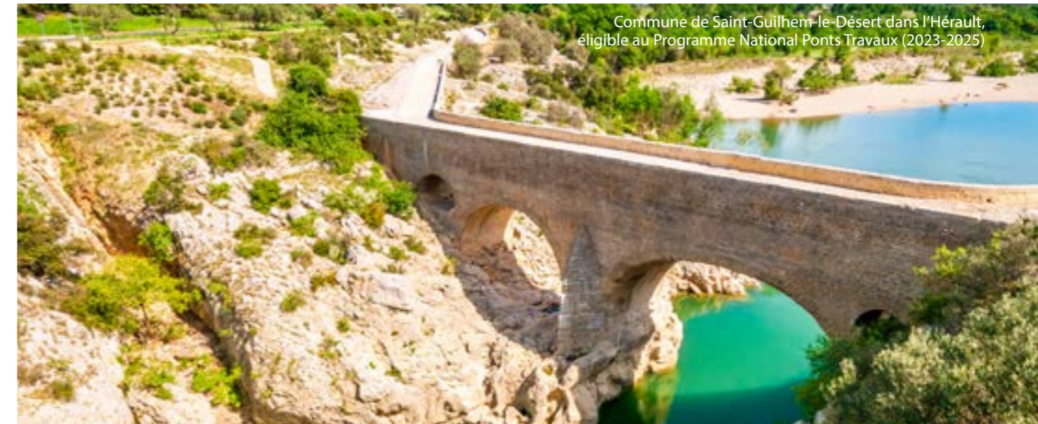
Commune de Saint-Guilhem-le-Désert dans l'Hérault, éligible au Programme National Ponts Travaux (2023-2025)