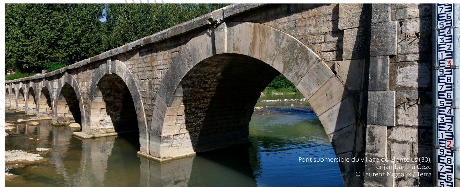
Pont submersible du village de Montclus (30), enjambant la Cèze