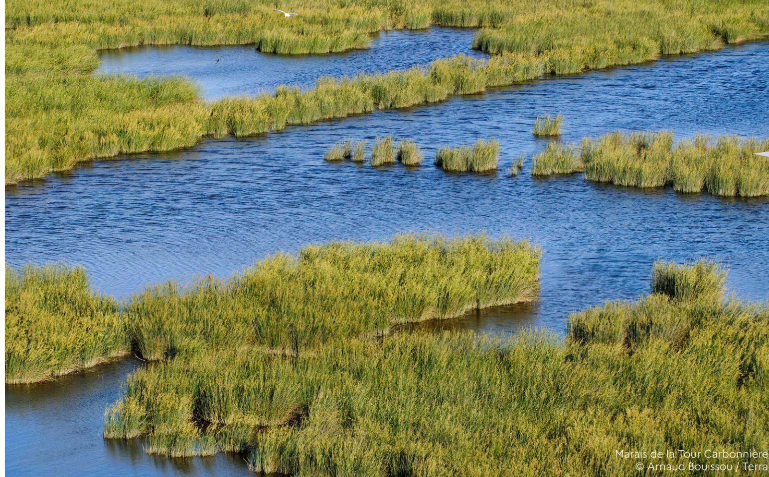
Marais de la Tour Carbonnière