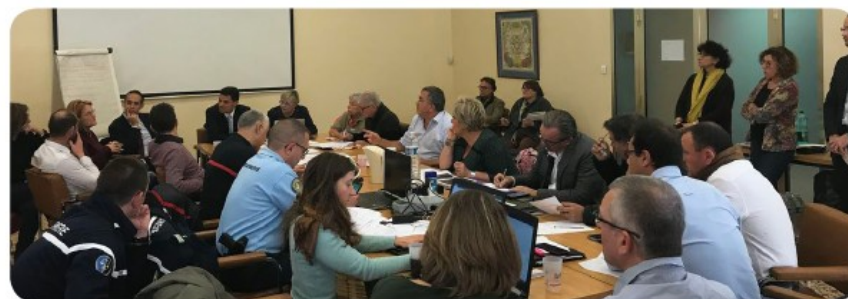
Le PCC en action