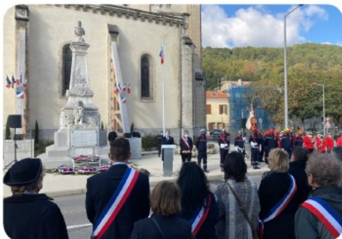
Commémoration du séisme du Teil le 11 novembre 2020.