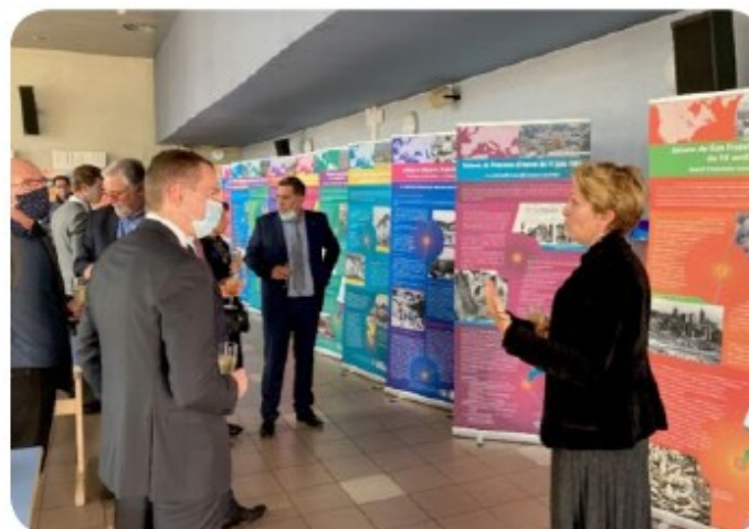
Exposition AFPS lors de la commémoration du séisme du Teil le 11 novembre 2020.