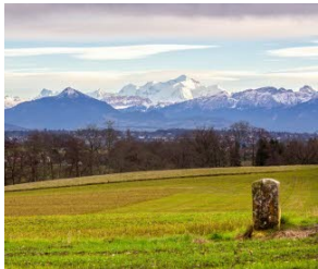
Circuit des Bornes.