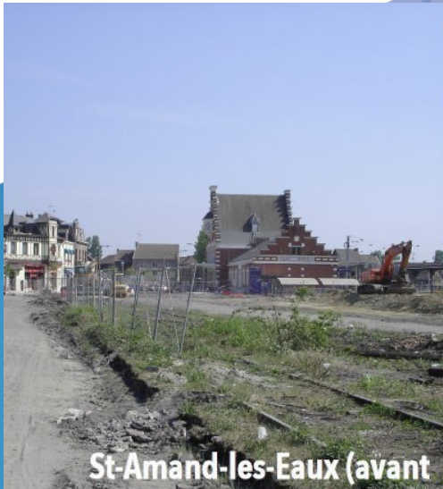
St-Amand-les-Eaux (avant / après)

Mettre le train au service d'une mobilité durable