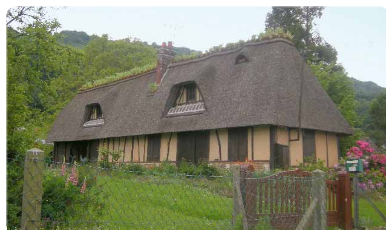
Cette chaumière située au Marais Vernier est implantée dans le sens de la pente pour faciliter l'écoulement des eaux de ruissellement. Sa toiture de chaume assure une bonne isolation.