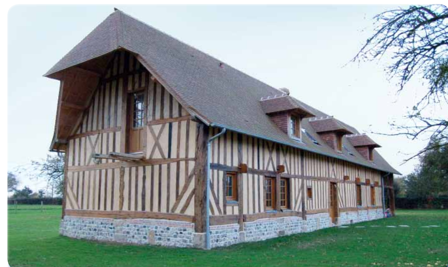
La toiture se finissant en queue de geai assure une protection de la façade la plus exposée à la pluie et protège la porte d'accès au grenier.