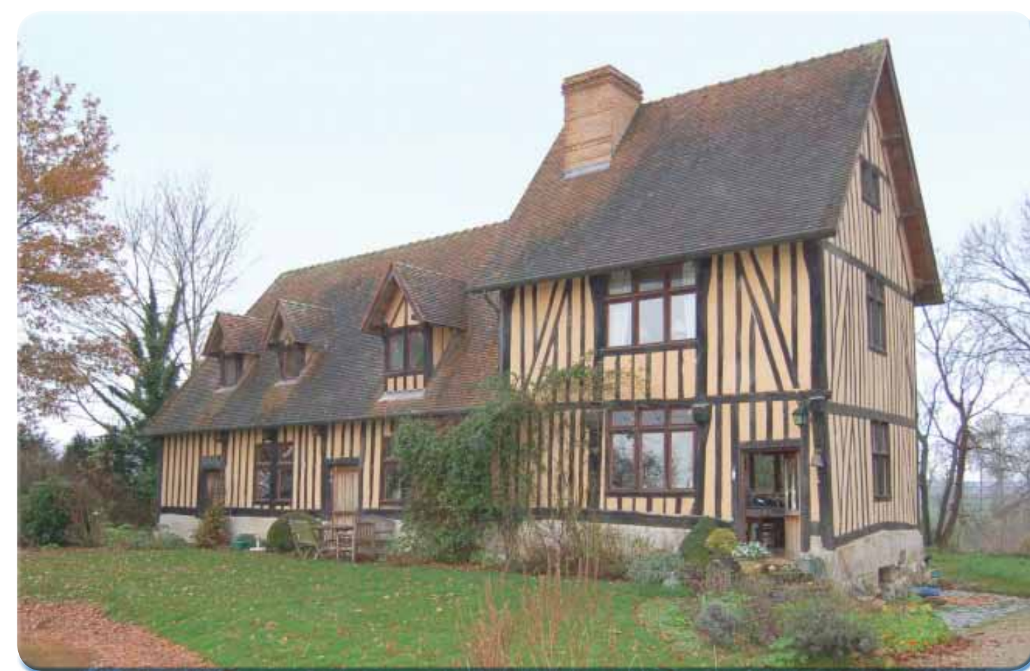
Inertie moyenne des constructions à pan de bois utilisant le torchis.

« L'habitat ancien possède en général de précieuses qualités sur le plan de l'efficacité énergétique, qui le rapproche de ce que l'on appelle aujourd'hui l'habitat bioclimatique ... il était aussi conçu de manière durable et avec des matériaux locaux. » - Source AREHN