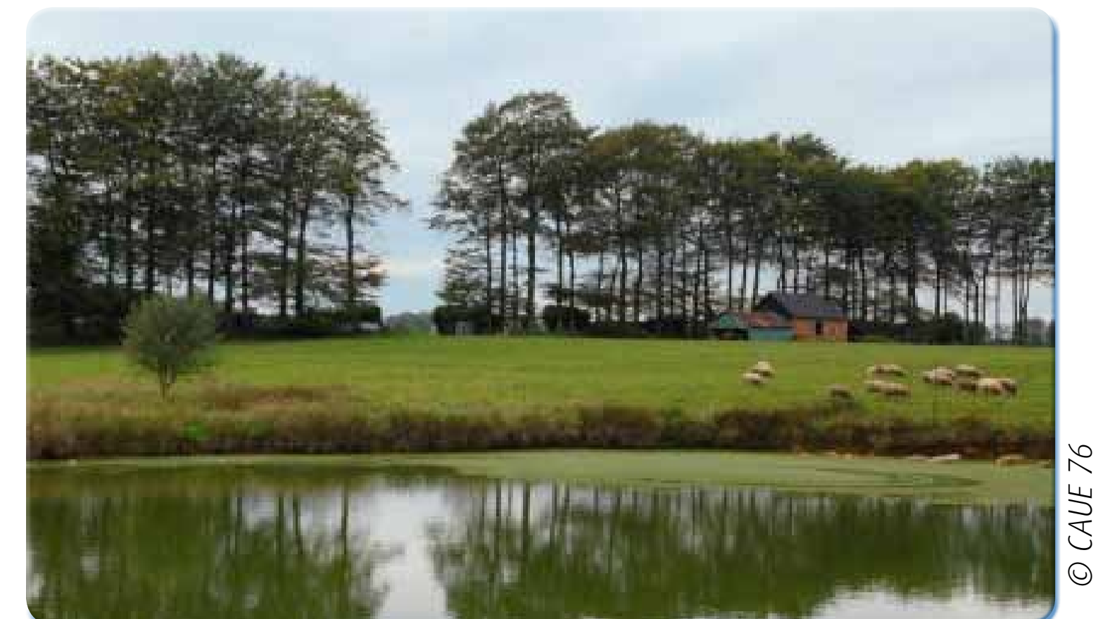
Au sein du clos-masure les arbres assurent une protection des habitations et des animaux contre le vent. Les mares constituent une réserve d'eau permanente, elles étaient aussi très nombreuses dans les villages.