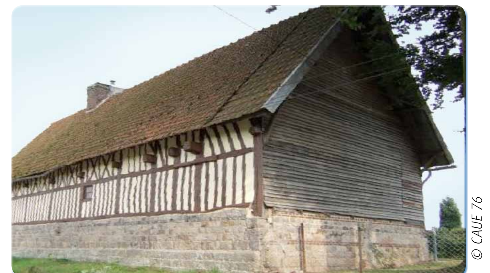
L'essentage de bois assure une protection de la façade la plus exposée à la pluie.