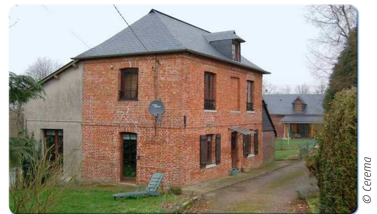
L'ajout d'une annexe sur la façade nord isole la maison du froid.

« L'habitat ancien possède en général de précieuses qualités sur le plan de l'efficacité énergétique, qui le rapproche de ce que l'on appelle aujourd'hui l'habitat bioclimatique ... il était aussi conçu de manière durable et avec des matériaux locaux. » - Source AREHN