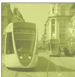
SECTEUR PUBLIC LOCAL