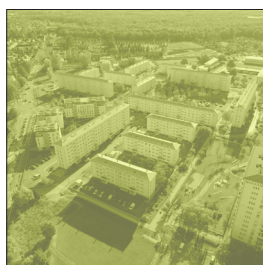
POLITIQUE DE LA VILLE