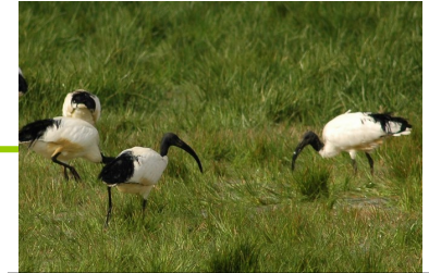
Ibis sacré (SD44, ONCFS)