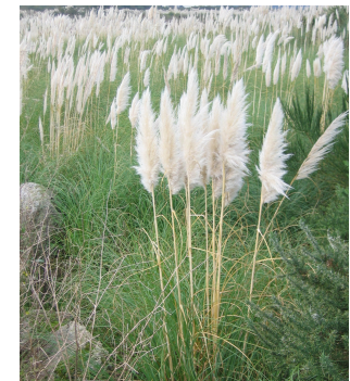
Herbe de la Pampa (SD44, ONCFS)