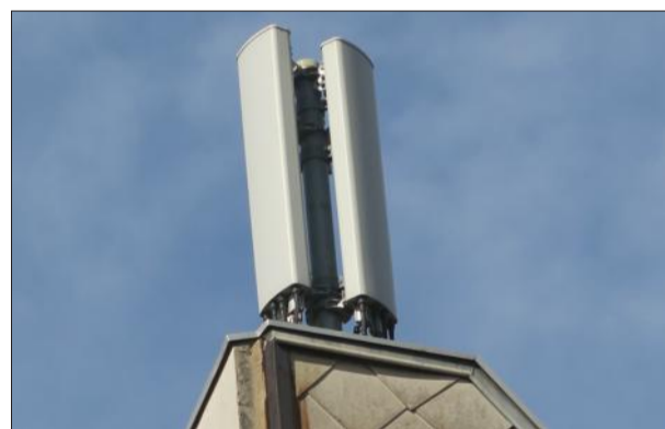
Deux antennes sont installées au-dessus du centre Victor-Hugo.